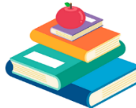
KARYA BAHASA DAN SASTRA

https://psbsekolah.kemdikbud.go.id/pustaka_maya.html