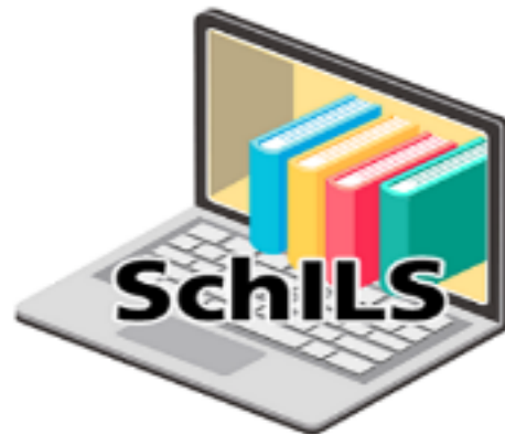
SCHOOL INTEGRATED LIBRARY SYSTEM